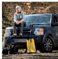
NIESTRASZONA W PRACY

Zastawiła dom i kupiła kopalnię złota. "Nie będę przepraszać, że na tym zarabiam"