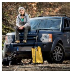
NIESTRASZONA W PRACY

Zastawiła dom i kupiła kopalnię złota. "Nie będę przepraszać, że na tym zarabiam"